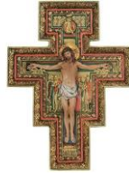
El Cristo de San Damián: